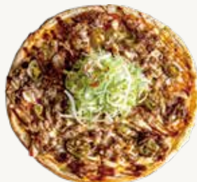
돌배기피자 Beef Brisket Pizza