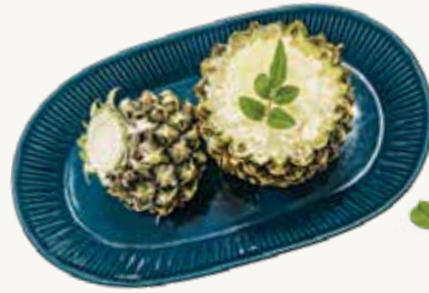
파인애플셔벗 Pineapple Sherbet