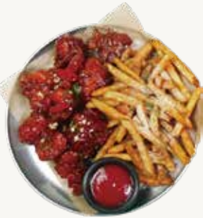
닭강정 & 감자튀김 Sweet and Spicy Chicken with Fried Potato