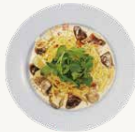
까르보나라파스타 Carbonara Pasta