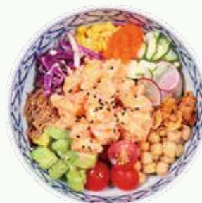
연어 와사비 포케 Salmon Wasabi Poke