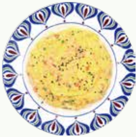
게살 계란 볶음밥 Crap with Egg Fried Rice