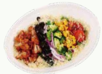
청양 치킨 콥 샐러드 Chengyang Pepper Chicken Cobb Salad