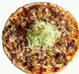
돌배기피자 Beef Brisket Pizza