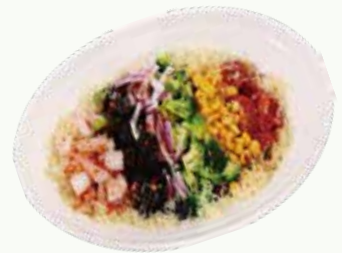
오리엔탈 쉬림프 콥 샐러드 Oriental Dressing with Cobb Salad