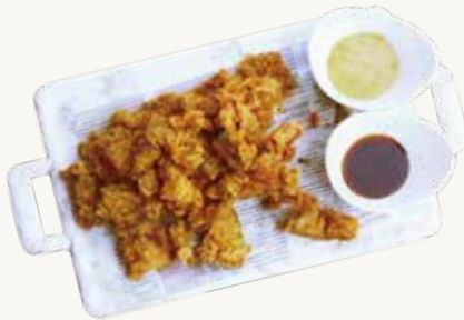
돼지갈비후라이드양념 Seasoned Fried Galbi