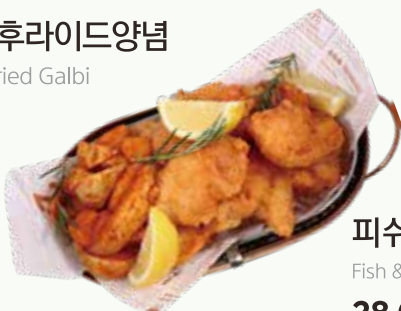
피쉬&칩스 Fish & Chip's