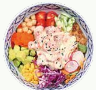
새우 아이올리 포케 Shrimp Aioli Poke