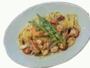
쉬림프오일파스타 Shrimp Oil Pasta