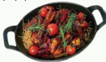
블랙 트러플 쉬림프 Black Truffle Shrimp