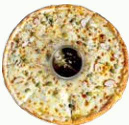
고르곤졸라피자 Gorgonzola Pizza