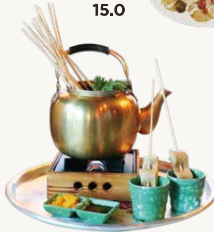
주뎡탕 Fish Cake Soup