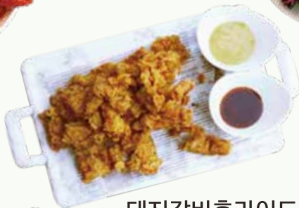
돼지갈비후라이드 Fried Galbi