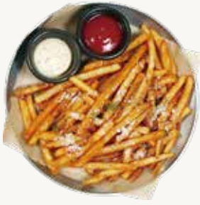
트러플 감자튀김 Truffle-Oil French Fries