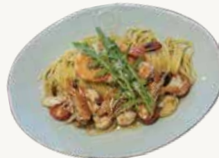
쉬림프오일파스타 Shrimp Oil Pasta