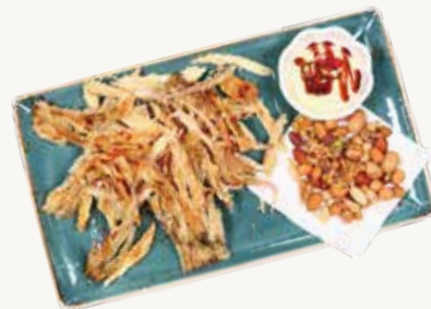
마른안주 Dried Snacks