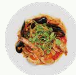
올드베이클램파스타 Old Bay Clam Pasta