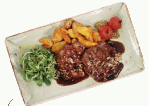
Iberico Pork Steak 이베리코 목살 스테이크 (260g)