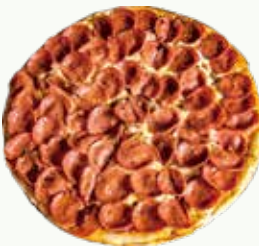
페페로니피자 Pepperoni Pizza