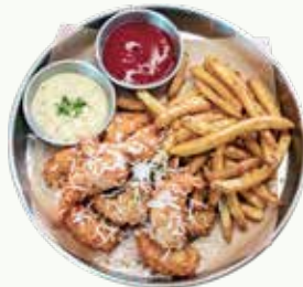
코코넛 쉬림프 튀김 Coconut Shrimp Fried