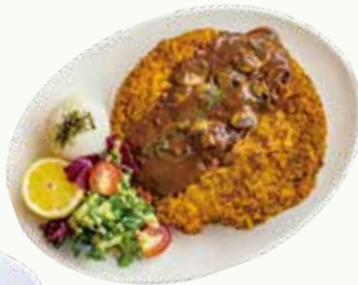
옛날왕돈가스 Pork Cutlet