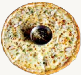
고르곤졸라피자 Gorgonzola Pizza