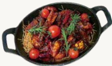
블랙 트러플 쉬림프 Black Truffle Shrimp