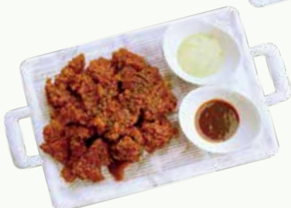
돼지갈비후라이드양념 Seasoned Fried Galbi