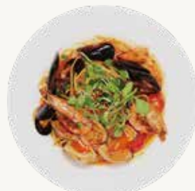
올드베이클램파스타 Old Bay Clam Pasta