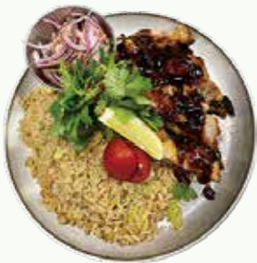
케이준치킨필라프 Cajun Chicken Pilaf