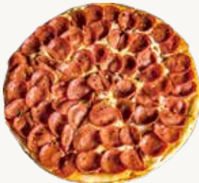
페페로니피자 Pepperoni Pizza