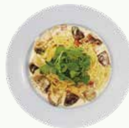
까르보나라파스타 Carbonara Pasta