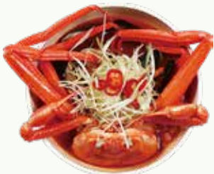
홍게라면 Red Crab Ramen